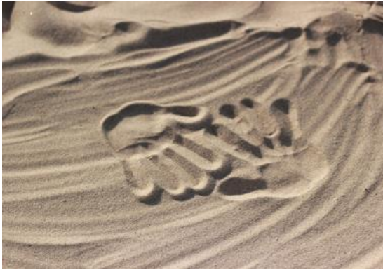
«Веселые отпечатки на песке»

В ходе этой игры малыши знакомятся со свойствами горной породы, развивают воображение и координацию движений. Педагог вместе с ними делает отпечатки рук и ног. Для развития воображения можно предложить детям дорисовать отпечатки, превращая их в затейливые узоры.